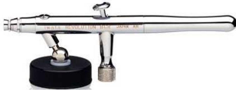
Art.-No. 200 005 Düsenstärke: 0,5 mm (umrüstbar auf 0,3 mm)

Unsere Airbrush-Serien zeichnen sich durch besondere Eigenschaften aus. Einige der besten und bekanntesten Künstler der Welt arbeiten damit. Künstler vertrauen auf IWATA aufgrund der überzeugenden Produktqualität. Um Ihnen zu helfen Ihre Ideen bestmöglichst umzusetzen, produziert IWATA die innovativsten Farbspritzpistolen von höchster Qualität – entwickelt und getestet von Künstlern für Künstler. Alle IWATA-Produkte werden kompromisslos nach den höchsten Standards designed und entwickelt