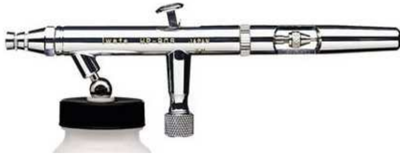
Art.-No. 200 023 Düsenstärke: 0,5 mm (umrüstbar auf 0,3 mm)

Unsere Airbrush-Serien zeichnen sich durch besondere Eigenschaften aus. Einige der besten und bekanntesten Künstler der Welt arbeiten damit. Künstler vertrauen auf IWATA aufgrund der überzeugenden Produktqualität. Um Ihnen zu helfen Ihre Ideen bestmöglichst umzusetzen, produziert IWATA die innovativsten Farbspritzpistolen von höchster Qualität – entwickelt und getestet von Künstlern für Künstler. Alle IWATA-Produkte werden kompromisslos nach den höchsten Standards designed und entwickelt