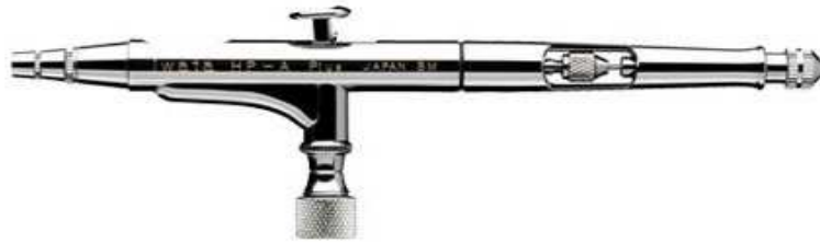
Art.-No. 200 041 Düsenstärke: 0,2 mm (umrüstbar auf 0,3 mm)

Unsere Airbrush-Serien zeichnen sich durch besondere Eigenschaften aus. Einige der besten und bekanntesten Künstler der Welt arbeiten damit. Künstler vertrauen auf IWATA aufgrund der überzeugenden Produktqualität. Um Ihnen zu helfen Ihre Ideen bestmöglichst umzusetzen, produziert IWATA die innovativsten Farbspritzpistolen von höchster Qualität – entwickelt und getestet von Künstlern für Künstler. Alle IWATA-Produkte werden kompromisslos nach den höchsten Standards designed und entwickelt